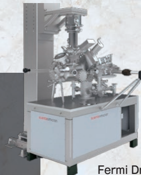
Fermi DryCool SPM