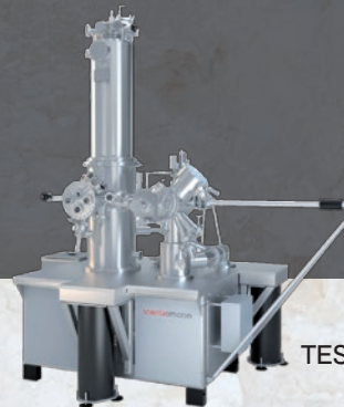
TESLA JT SPM